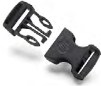
HP 3D High Reusability PA 11