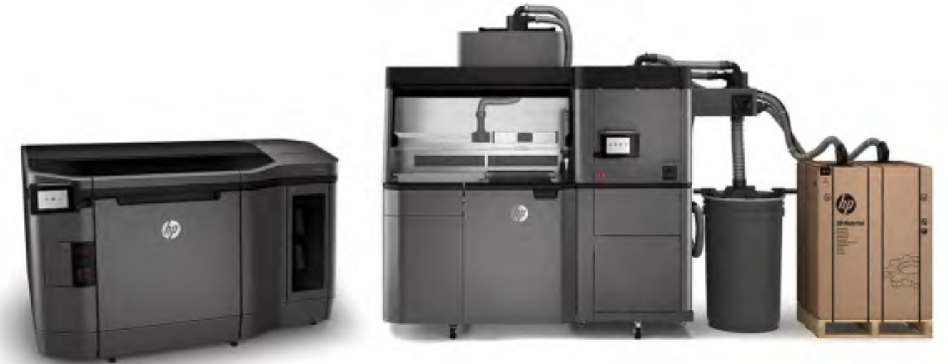
HP JetFusion 4200