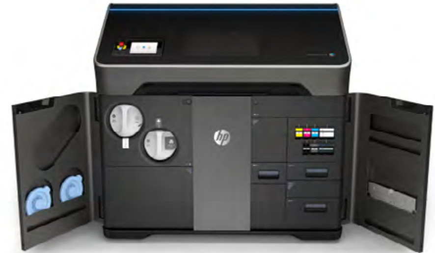
HP JetFusion 500/300

Realizzate splendidi componenti funzionali a colori, in bianco o in nero mantenendo al contempo proprietà meccaniche ottimali.