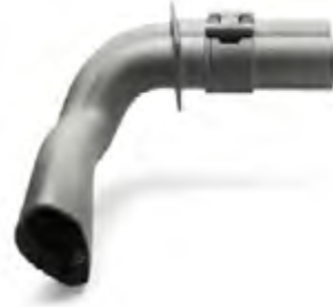
HP 3D High Reusability PA 12