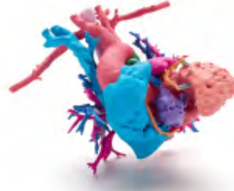
Dati per gentile concessione del Phoenix Children's Hospital; Cuore di Jemma Supporto visivo