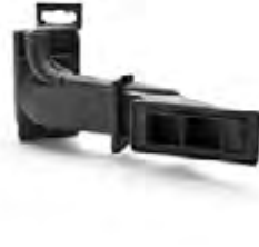
HP 3D High Reusability PA 12