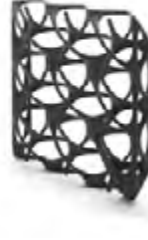
Vestosint 3D Z2773 PA 12