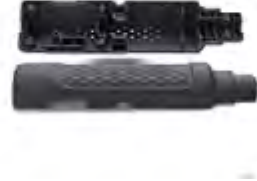
HP 3D High Reusability PA 12 GB