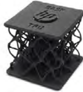
BASF Ultrasint 3D TPU01