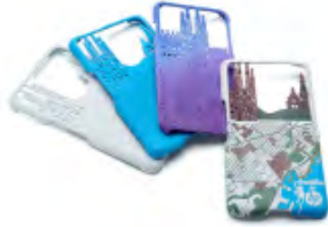
Dati per gentile concessione di FreshFiber Prototipo di case per smartphone