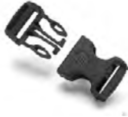
HP 3D High Reusability PA 11