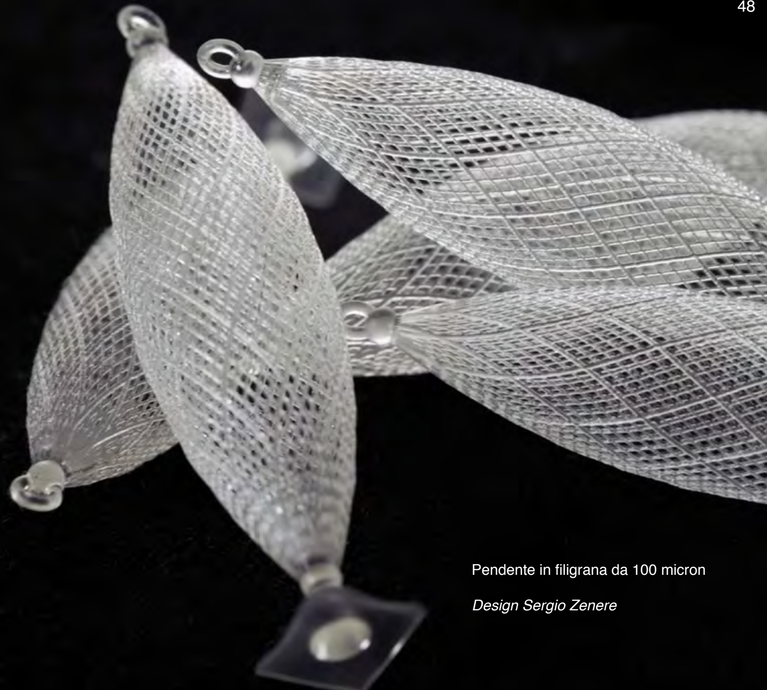
Pendente in filigrana da 100 micron

La geometria complessa e sottile può essere ottenuta con il materiale DWS Fusia DC710 . I vantaggi dei materiali fondibili DWS sono: affidabilità, ripetibilità e procedure semplici per la fusione diretta. Il filo del pendente ha uno spessore di 100 micron ed è stato premiato al Santa Fe Symposium nel 2013 come il prodotto di gioielleria più sottile al mondo realizzato da una stampante 3D.