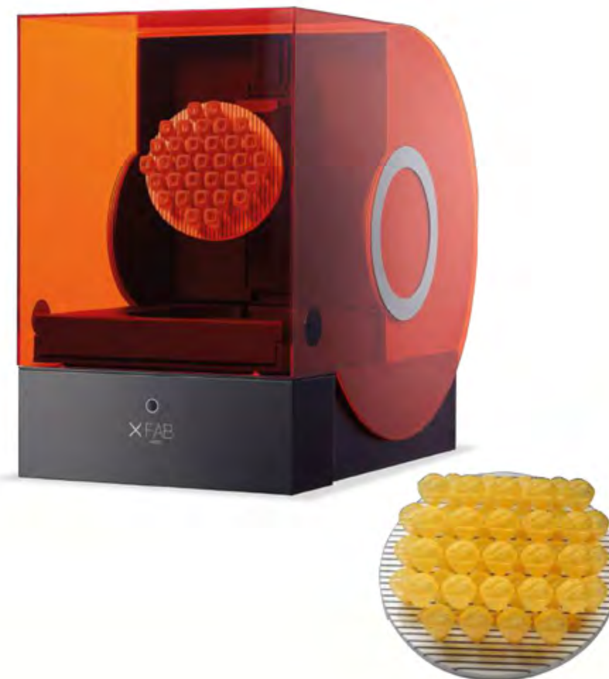
x FAB 2000