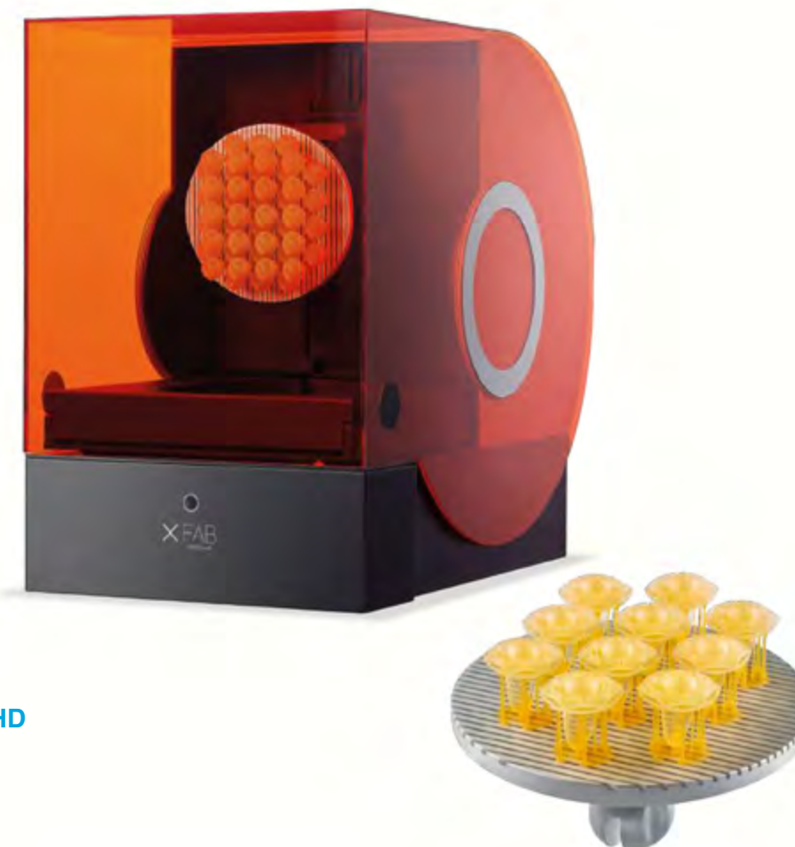
x FAB 2500 HD