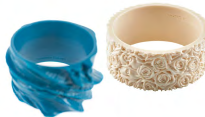
Bracciali “Rosaspina” e “Onda”