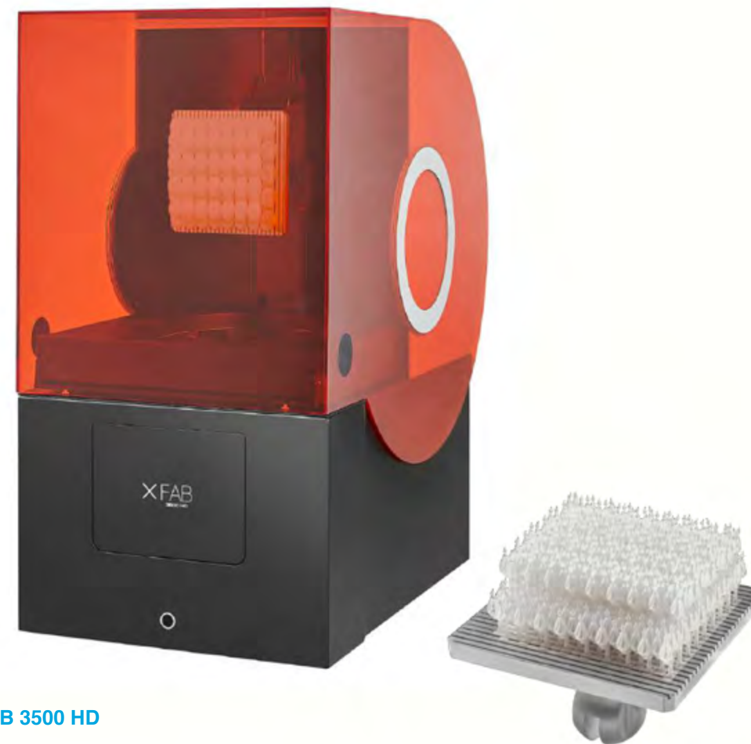
x FAB 3500 HD